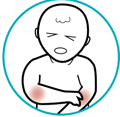
د عضلاتو او ګډ درد

ستاسو ماشوم د ځينو واکسينونو وروسته ممکن کوم جانبي عوارض ولري.