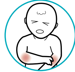
Douleurs musculaires et articulaires