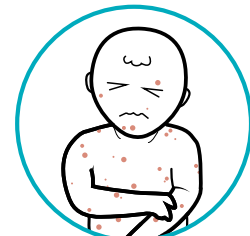
Après les vaccins ROR contre la varicelle : de la fièvre, une éruption cutanée et d'autres effets secondaires peuvent survenir environ 1 à 2 semaines après l'immunisation