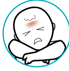
Fatigue et maux de tête