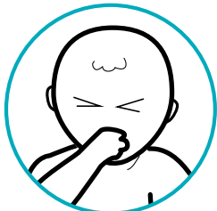
Nausées, vomissements et diarrhée