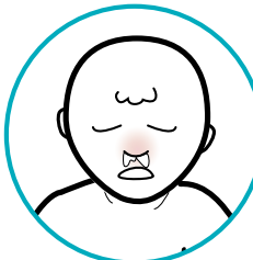
Après le vaccin par pulvérisation nasale contre l'influenza (grippe) : congestion nasale et écoulement nasal