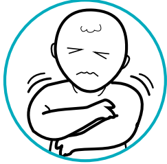
Fièvre et frissons